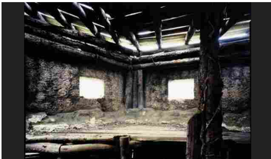
Carlo Valsecchi, # 01132 Asiago, Vicenza, IT. 2020, 2020, c Print, plexiglas con dibond, 125 x 160 cm © Carlo Valsecchi