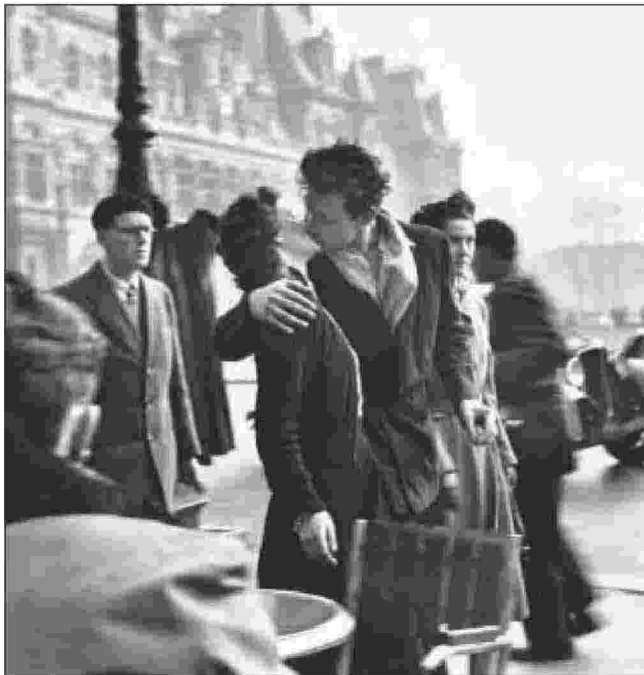
Robert Doisneau, Le baiser de l'hôtel de ville, Paris 1950