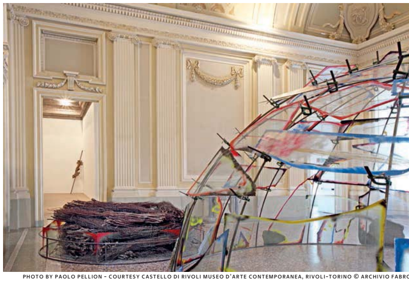
PHOTO BY PAOLO PELLION - COURTESY CASTELLO DI RIVOLI MUSEO D'ARTE CONTEMPORANEA, RIVOLI-TORINO © ARCHIVIO FABRO