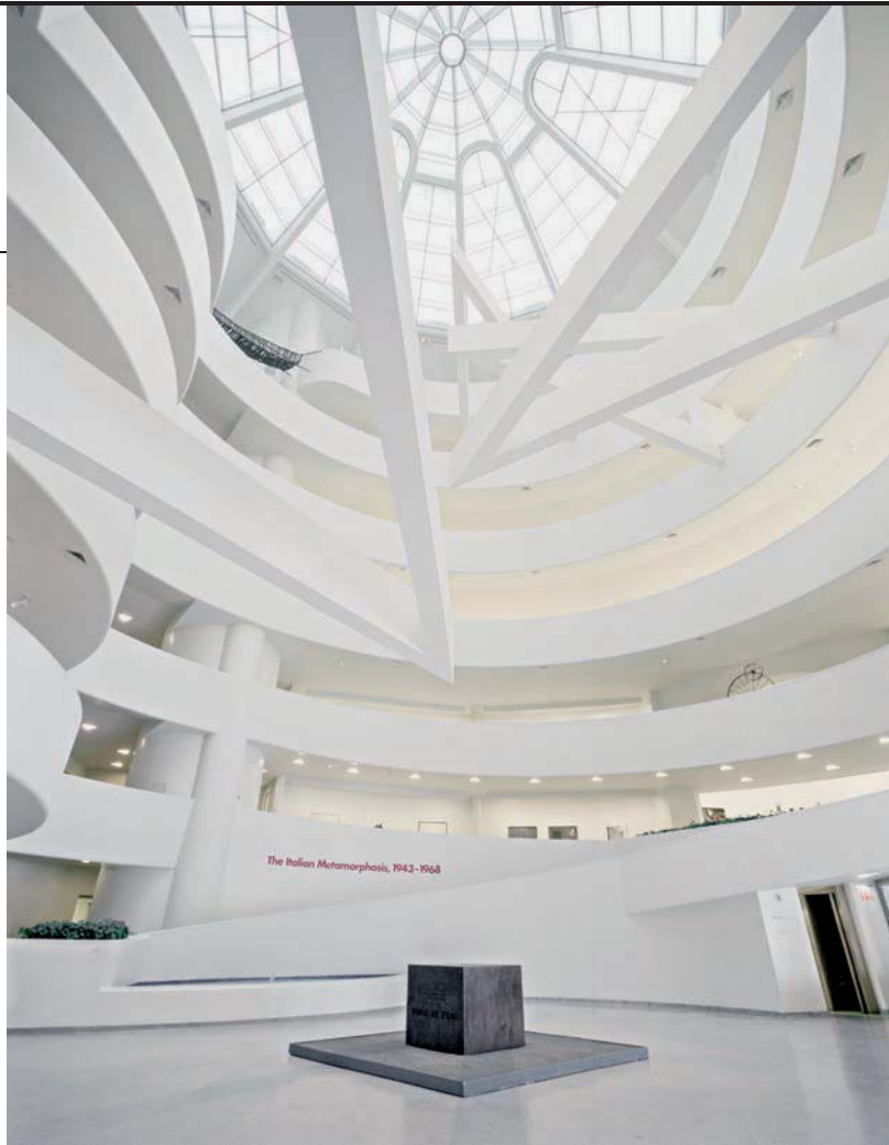
PHOTO BY DAVID HEALD - COURTESY SOLOMON R. GUGGENHEIM MUSEUM, NEW YORK © PIERO MANZONI, BY SIAE 2021