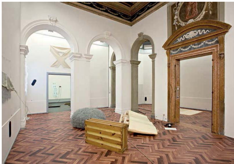
PHOTO BY ATTILIO MARAZZANO - COURTESY FONDAZIONE PRADA - COURTESY GARY KUEHN AND HÄUSLER CONTEMPORARY © ESTATE OF WALTER DE MARIA