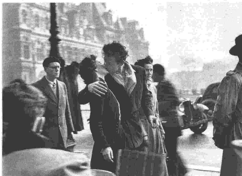
Icona Robert Doisneau, Le baiser de l'Hôtel de Ville , una delle foto più famose del XX secolo (Paris, 1950)

A firmarla, su commissione della rivista americana «Life» nel 1950, Robert Doisneau (1912-1994), fotografo cui è dedicata la mostra inaugurata ieri nelle sale del Museo dell'Ara