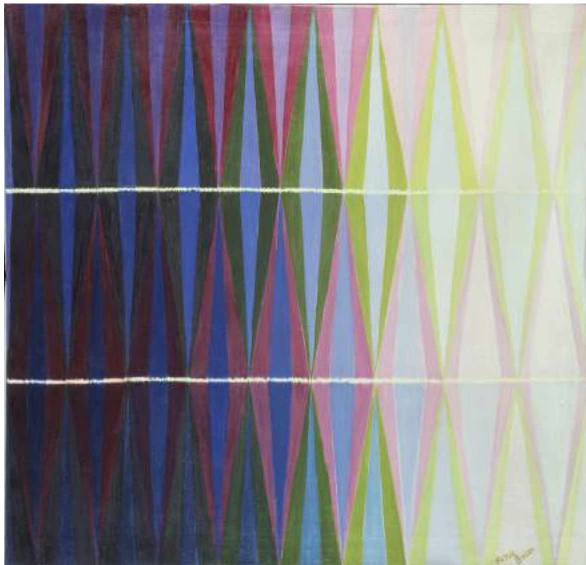
16. Giacomo Balla, Compenetrazione iridescente n.7 , 1912. Torino, GAM - Galleria Civica d'Arte Moderna e Contemporanea

pochi viaggi in Europa, da mirate frequentazioni, con alcune riprese di studi e di pubblicazioni, e con frequenti soggiorni nella casa di Droneo durante i quali matura l'idea di una casa museo. Le croniche problematiche di salute, che sono alla base di una volontaria dimissione dagli impegni istituzionali, impongono di stilare il testamento, in data 15 aprile 1976, nel quale Mallé decide di lasciare al Comune di Droneo: “[...] la casa in via IV Novembre 54 e tutto quanto in essa contenuto al momento del mio decesso [...] facendo carico allo stesso comune dei seguenti oneri: 1°) Istituzione di un Museo, a mio nome ed in detto stabile, di quadri, stampe, mobili, porcellane, ed in genere di tutti gli oggetti di pregio artistico che vi si trovano [...]” 77 , citando esplicitamente alcune categorie di opere in un ultimo personale inventario, dopo i tanti che aveva redatto per i musei civici.