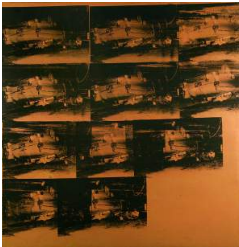
15. Andy Warhol, Orange Car Crash , 1964. Torino, GAM - Galleria Civica d'Arte Moderna e Contemporanea (su concessione della Fondazione Torino Musei)

pevole dell'importanza del lascito a cui dedicò sei mesi di prolungata esposizione nelle sale del museo e i successivi progetti di itineranza in altre sedi museali italiane, come ricorda in una lettera a Emilio Vedova 71 .