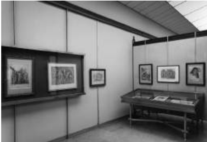
6. Una sala della mostra L'incisione europea dal XV al XX secolo , Torino, Galleria Civica d'Arte Moderna, aprile-giugno 1968.