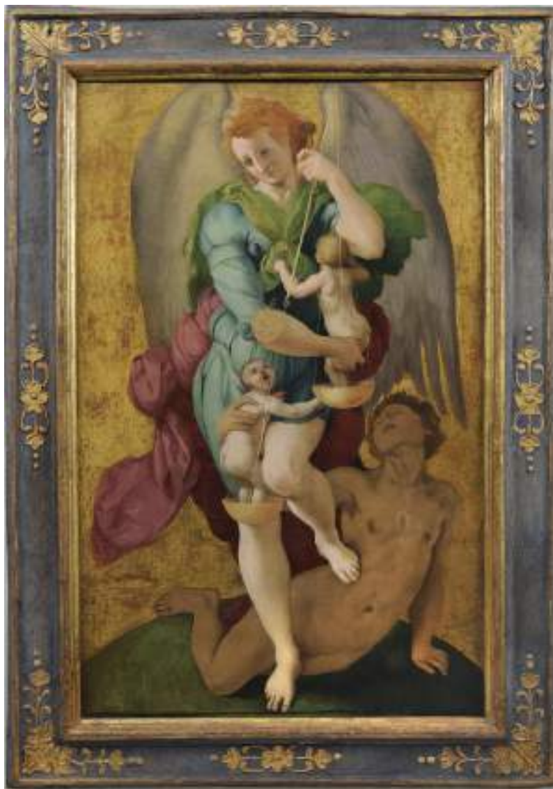
4. Agnolo di Cosimo detto il Bronzino, San Michele arcangelo e il demonio , 1525-1528. Torino, Palazzo Madama - Museo Civico d'Arte Antica, inv. 479/D