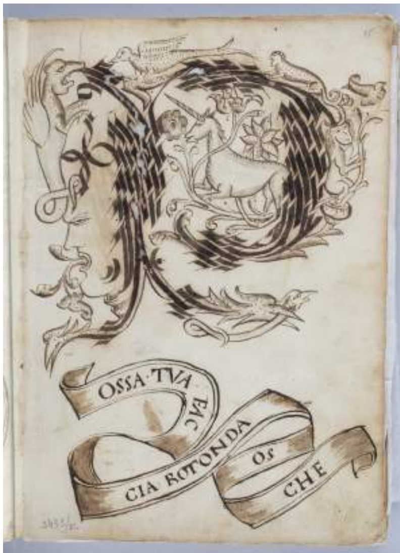
5. Iniziale "P" in inchiostro nero con un unicorno e altri ibridi zoomorfi, da un quaderno con lettere e alfabeti figurati e ornati, noto come Libro di lettere astrologiche , prima metà del XVI secolo. Torino, Palazzo Madama - Museo Civico d'Arte Antica, inv. 3433/DS

ha aiutato l'organizzazione di questo "cantiere" perché è stato possibile allestire una sorta di sala studio/gabinetto fotografico in Deposito Ceramiche, un ambiente solitamente aperto al pubblico, ma subito chiuso a marzo 2020 per problemi di accessibilità (passaggi troppo stretti che impedivano il distanziamento tra i visitatori). Il primo intervento ha quindi riguardato l'inserimento dei ritagli in cartelline non acide realizzate da Bottega Fagnola, a loro volta raccolte in scatole di cartone omogenee a quelle già contenenti i codici. Ha preso quindi l'avvio la campagna fotografica sistematica dei manoscritti e delle miniature ritagliate, a cura di Paolo Giagheddu, fotografo afferente al personale tecnico dell'Università di Torino, coadiuvato da Alessia Marzo, studiosa di miniatura medievale, dottore di ricerca del medesimo Ateneo e beneficiaria di una borsa di ricerca da Fondazione CRT per questo pro-