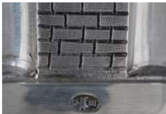
24. Luigi Dughet (mazza) e Carlo Balbino (corona), Mazza cerimoniale della Città di Torino , 1814 (mazza) e 1849 circa (corona). Torino, Palazzo Madama, inv. 279/A