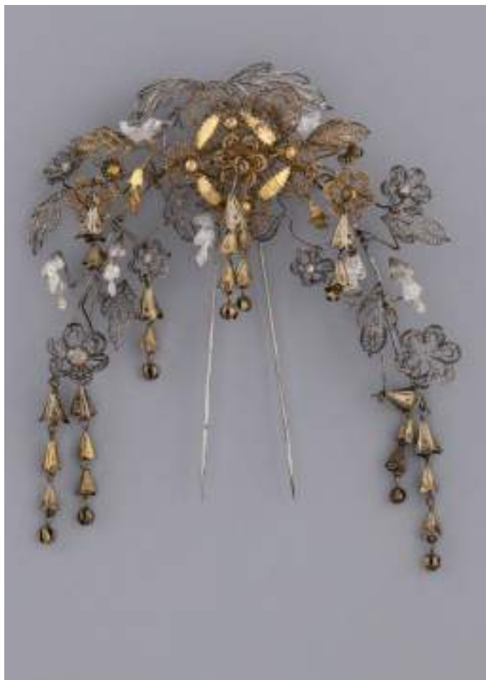
35. Orafo vercellese, Cercine (cerchio ornamentale per acconciatura), circa 1850-1870. Torino, Palazzo Madama, inv. 463