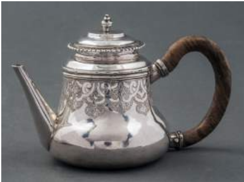
4. Giovanni Damodè, Paiola , circa 1740. Torino, Palazzo Madama, inv. 305/A