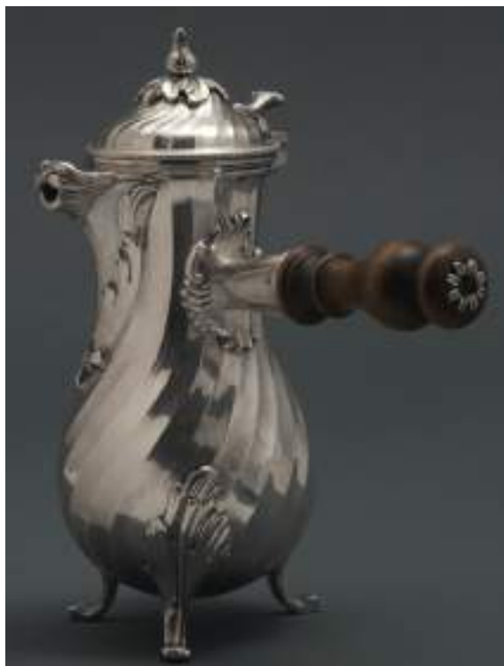
7. Giovanni Fino, Caffettiera , circa 1780. Torino, Palazzo Madama, inv. 291/A