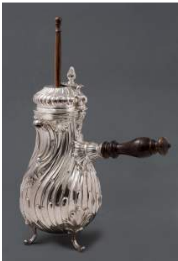
10. Giovanni Battista Boucheron (ambito), Caffettiera , circa 1790. Torino, Palazzo Madama, inv. 323/A