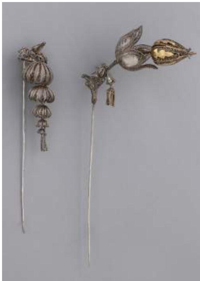
36. Orafo vercellese, Ornamenti a forcina con fiori e campanelle oscillanti , circa 1850-1870. Torino, Palazzo Madama, inv. 86/ORI

lizzato perché la proposta non trovò piena corrispondenza con le disposizioni del parroco, ma il progetto rimane uno dei migliori esempi di gusto rocaille dell'epoca, in cui la decorazione ispirata alla natura, giocata tra volute e conchiglie in un'alternanza di forme concave e convesse, rappresentava un punto di riferimento per tutti gli ornatisti della metà del Settecento.