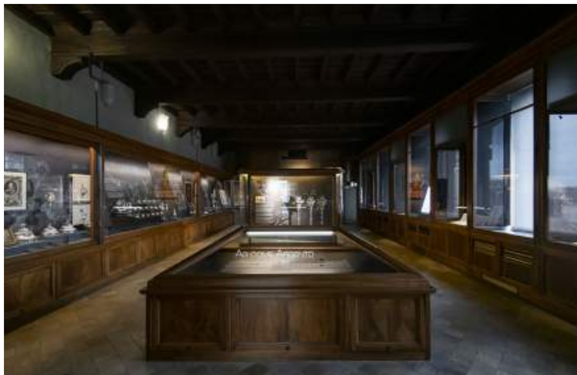
1. La mostra Argenti preziosi. Opere degli argentieri piemontesi allestita in Sala Atelier a Palazzo Madama

La mostra aveva l'obiettivo di studiare gli oggetti e rileggerli attraverso le tecniche di lavorazione, i sistemi di controllo fissati dalla corte sabauda per certificare la qualità della lega d'argento, la funzione, i processi creativi, gli stili e i modelli utilizzati, con particolare attenzione alle personalità degli argentieri e alle loro botteghe. Pertanto, si è cercato nel complesso delle collezioni del museo ogni riferimento al prezioso metallo che consentisse di diversificare al massimo la tipologia delle opere presentate. Esse spaziavano dai disegni di progetto ai ritratti degli argentieri, dalle stampe usate come modello agli oggetti veri e propri, dalle monete d'argento agli ornamenti per le acconciature,